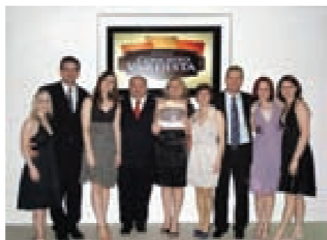
Prêmio foi concedido pela segunda vez

As 11 unidades do SESI Farmácia em Blumenau realizam mais de 65 mil atendimentos por mês. Com 80 estabe-