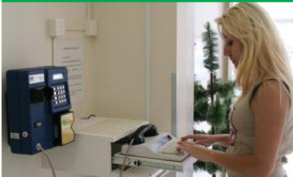
Telefone para surdos é um dos equipamentos didáticos oferecidos nas escolas