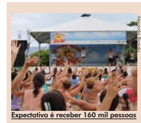
Expectativa é receber 160 mil pessoas