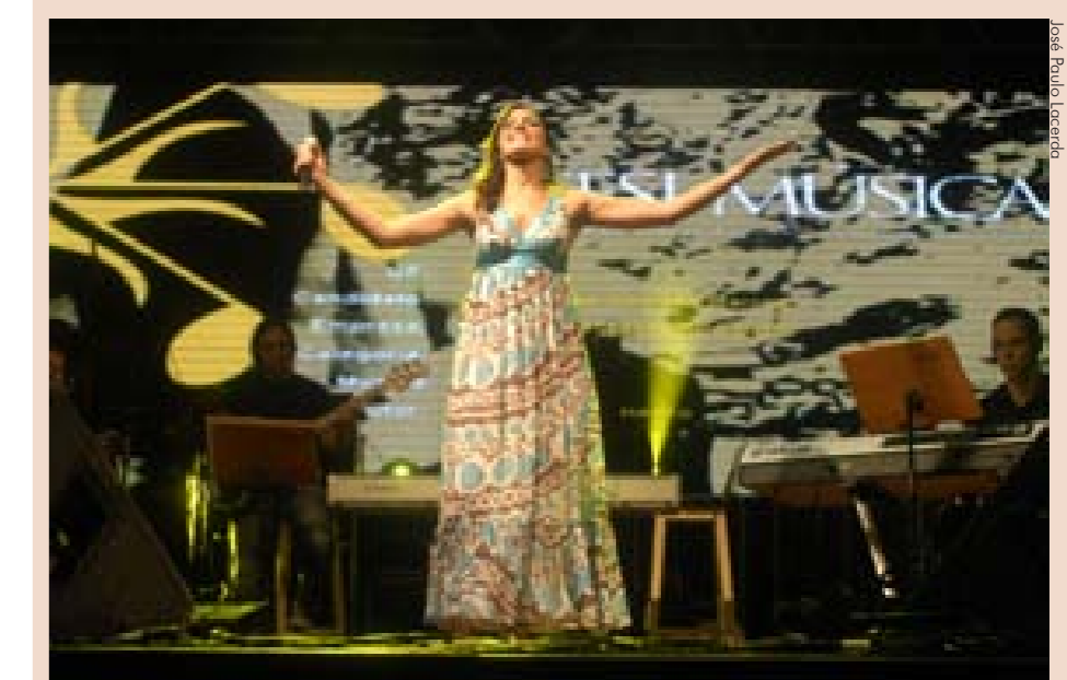
Mais de 70 trabalhadores de todo o Brasil participaram do evento

Foram mais de 70 trabalhadores que disputaram vagas na final em etapas classificatórias realizadas em Brasília nos dias 17, 18 e 19 de novembro. Os 20 classificados se apresentaram para cinco jurados e mais de três mil pessoas que prestigiaram o evento. O show de encerramento do festival foi feito por Hamilton de Holanda e Quinteto e Ivan Lins e Roberta Sá. Todo o evento foi transmitido ao vivo pela internet. Voltado para todos os gêneros e estilos da música brasileira, o festival dá oportunidade a trabalhadores da indústria de mostrarem o seu talento para compor, cantar ou tocar instrumentos.