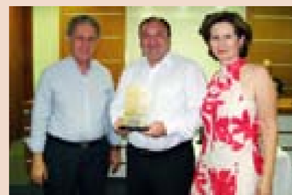
SIGRAF reconhece serviços do SESI/SC

O SESI/SC recebeu o Prêmio "Troféu Contribuição" concedido pelo Sindicato Patronal das Indústrias Gráficas de Florianópolis (SIGRAF) às entidades que contribuíram com algum benefício ao setor durante o ano de 2009.