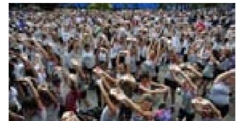
Objetivo foi estimular vida saudável

Trabalhadores da indústria e comunidade participaram, gratuitamente, de oficinas esportivas recreativas e de saúde.