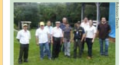
Equipe do SESI/SC fez visita in loco