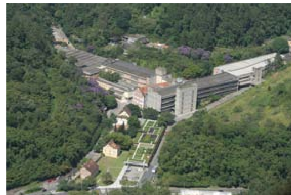
Cia. Hering obteve diagnóstico detalhado sobre qualidade de relacionamentos

A área de Responsabilidade Corporativa possibilita às indústrias a incorporação de uma gestão de sustentabilidade, conscientizando sobre a importância da responsabilidade social para o desenvolvimento dos negócios. Esses serviços ainda promovem a qualidade nos relacionamentos entre as indústrias e os colaboradores, fornecedores e comunidade. A área também auxilia empresas a tratarem de questões relacionadas ao processo de gestão do Clima Organizacional, da Diversidade, do Investimento Social Privado, Voluntariado Empresarial, Consumo Consciente, Preparação para Aposentadoria, Preparação para Certificação SA8000 e Liderança Sustentável.