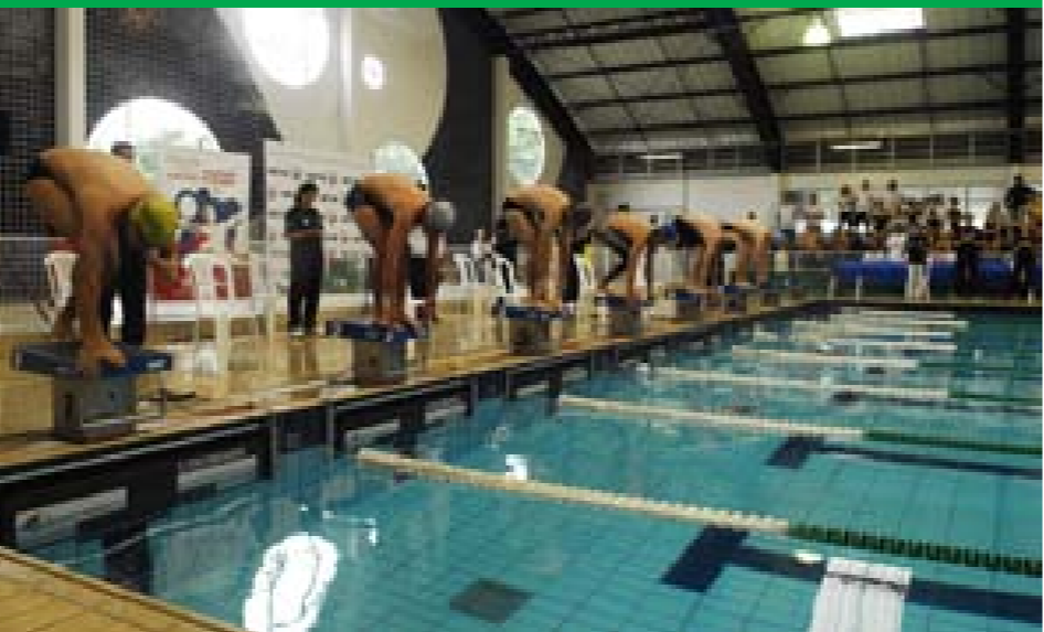
Natação foi uma das modalidades em disputa. Evento reuniu cerca de 800 atletas