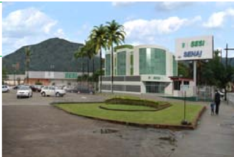
Clínica oferecerá atendimento em 18 especialidades de saúde

pio, o SESI Clínica de Jaraguá do Sul vai oferecer atendimento em engenharia de segurança do trabalho e 18 especialidades na área de saúde, entre as quais odontologia, clínica médica, ginecologia, pediatria, cardiologia, pneumologia, dermatologia, otorrinolaringologia, oftalmologia e ortopedia. "Com atendimento diferenciado, nosso foco é cuidar da saúde do trabalhador, buscando a prevenção e, quando houver a neces-